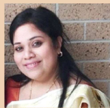
ആശ ജേക്കബ്ബ് മെൽബർ

എന്റെ താഴ്ചയിൽ എന്നെ ഓർത്തവനെ എന്റെ വീഴ്ചയിൽ എന്നെ താങ്ങിയവനെ എന്റെ ഭാരങ്ങൾ എല്ലാം വഹിച്ചവനെ